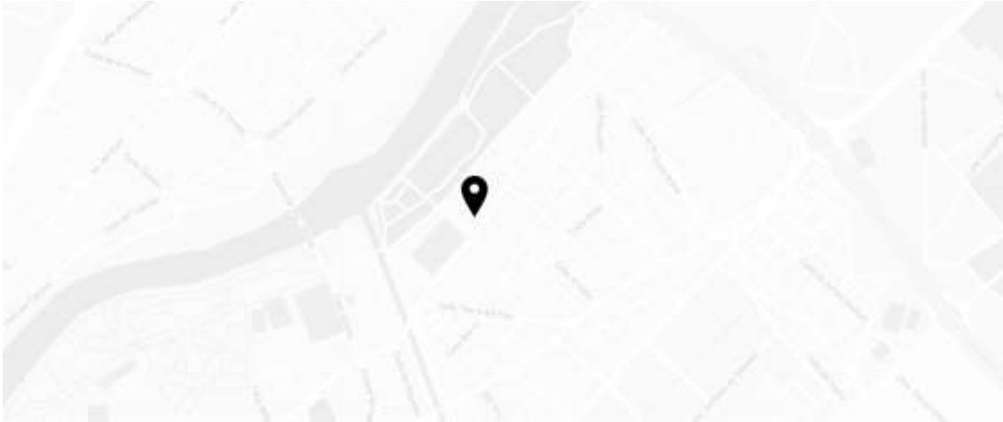
Sede AEICE - Salón de Actos (C/ Valle de Arán, 5, 47010, Valladolid)